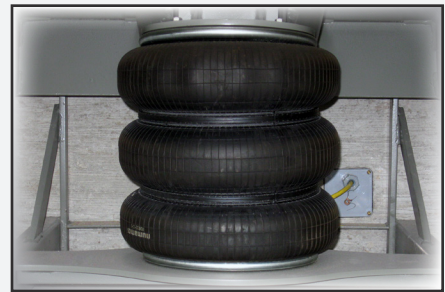
El sistema de fuelle de hule con correa de acero utiliza aire comprimido para elevar la plataforma.