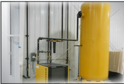
Simplemente conecte el CA al aire existente de la planta o a un compresor centralizado.